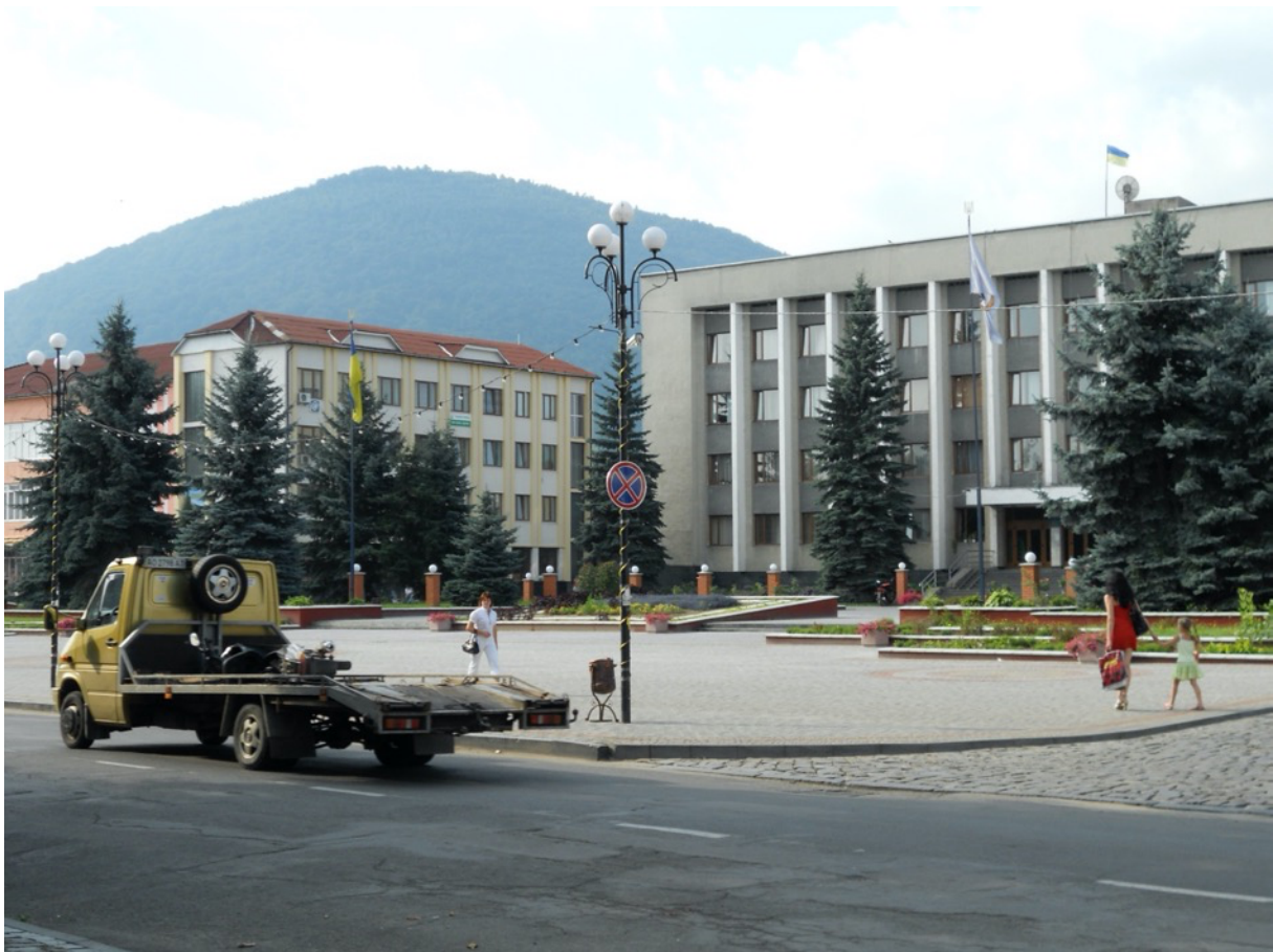
Tjatschiw liegt im Süden der Oblast, nahe der Grenze zu Rumänien.