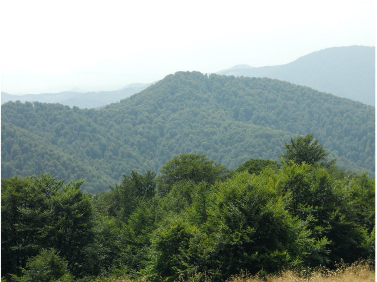
Der Buchenwald von Schyrokyj Luh (im Bild) gilt zusammen mit dem benachbarten Uholka als einer der grössten Buchenurwälder Europas.