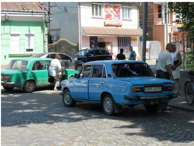
Das Regionalzentrum Chust – pulsierendes Leben in einer Kleinstadt.