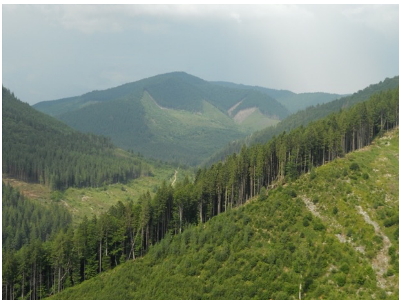
Holz – das grüne Gold der Karpaten.