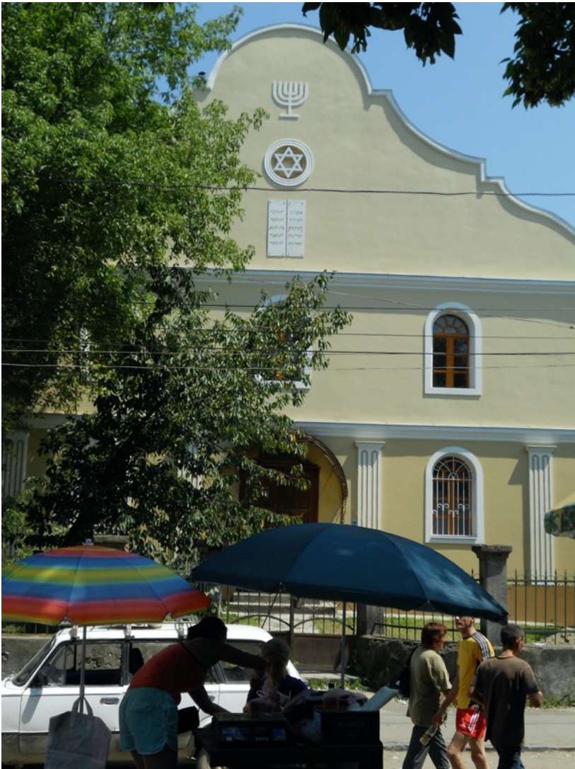
Eine orthodoxe Kirche (ganz oben) und eine Synagoge in Chust.