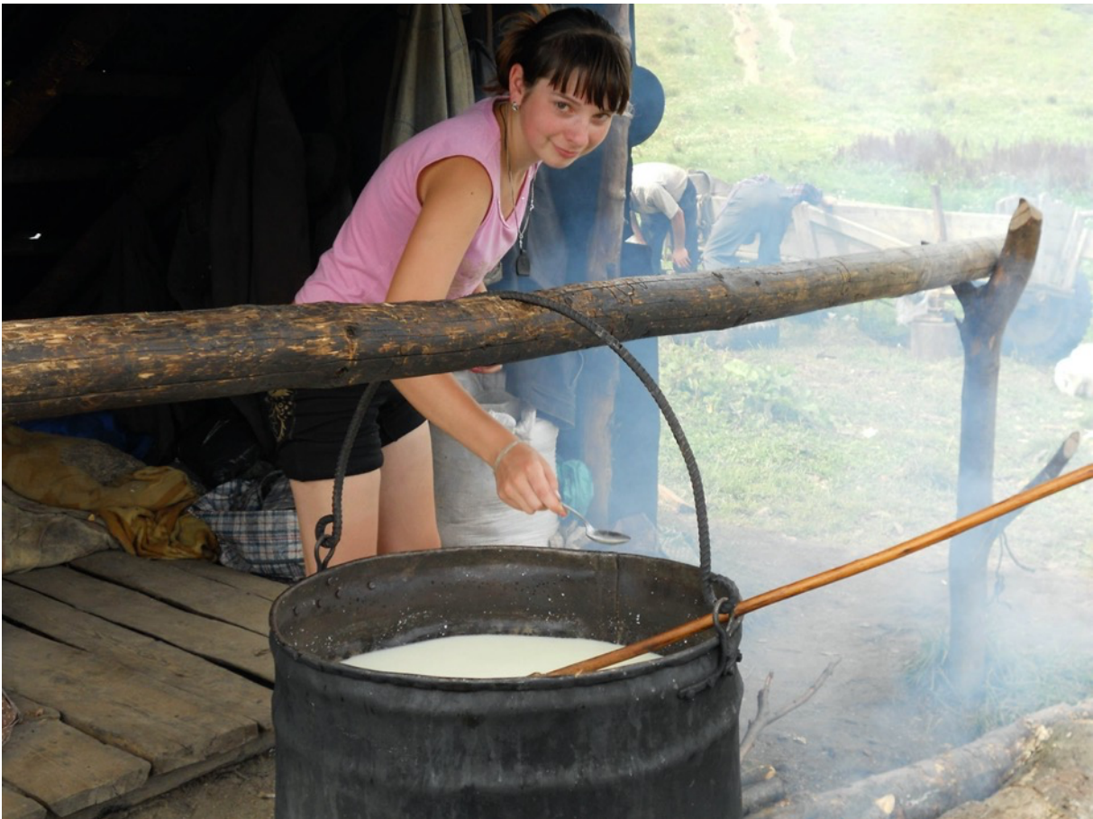
Käsen will gelernt sein ...