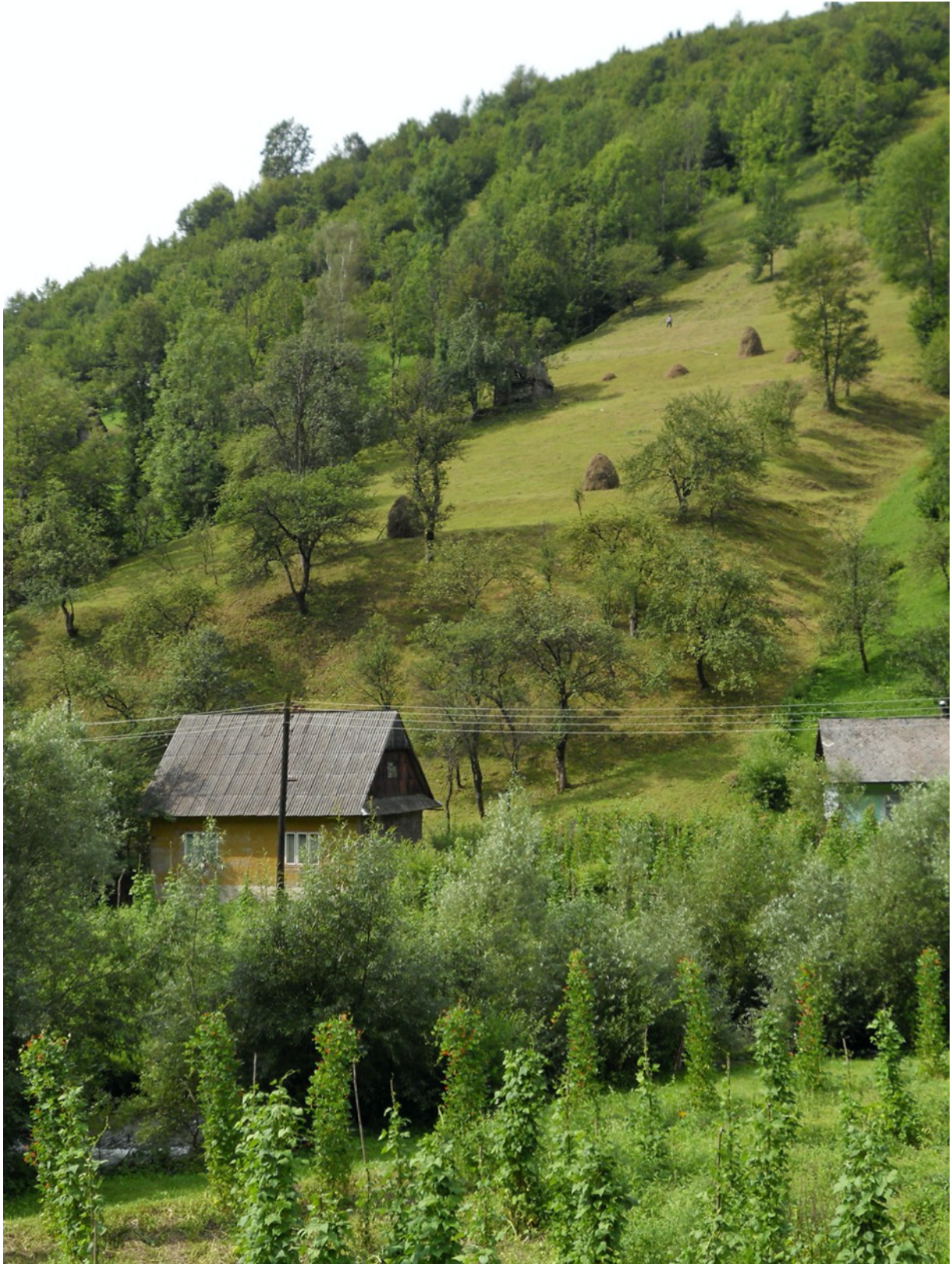
Hausgärten in Nyschny Bistryj.