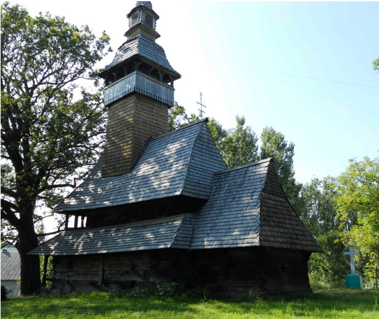
Eine für die Karpaten typische Holzkirche – hier diejenige von Kolodne.