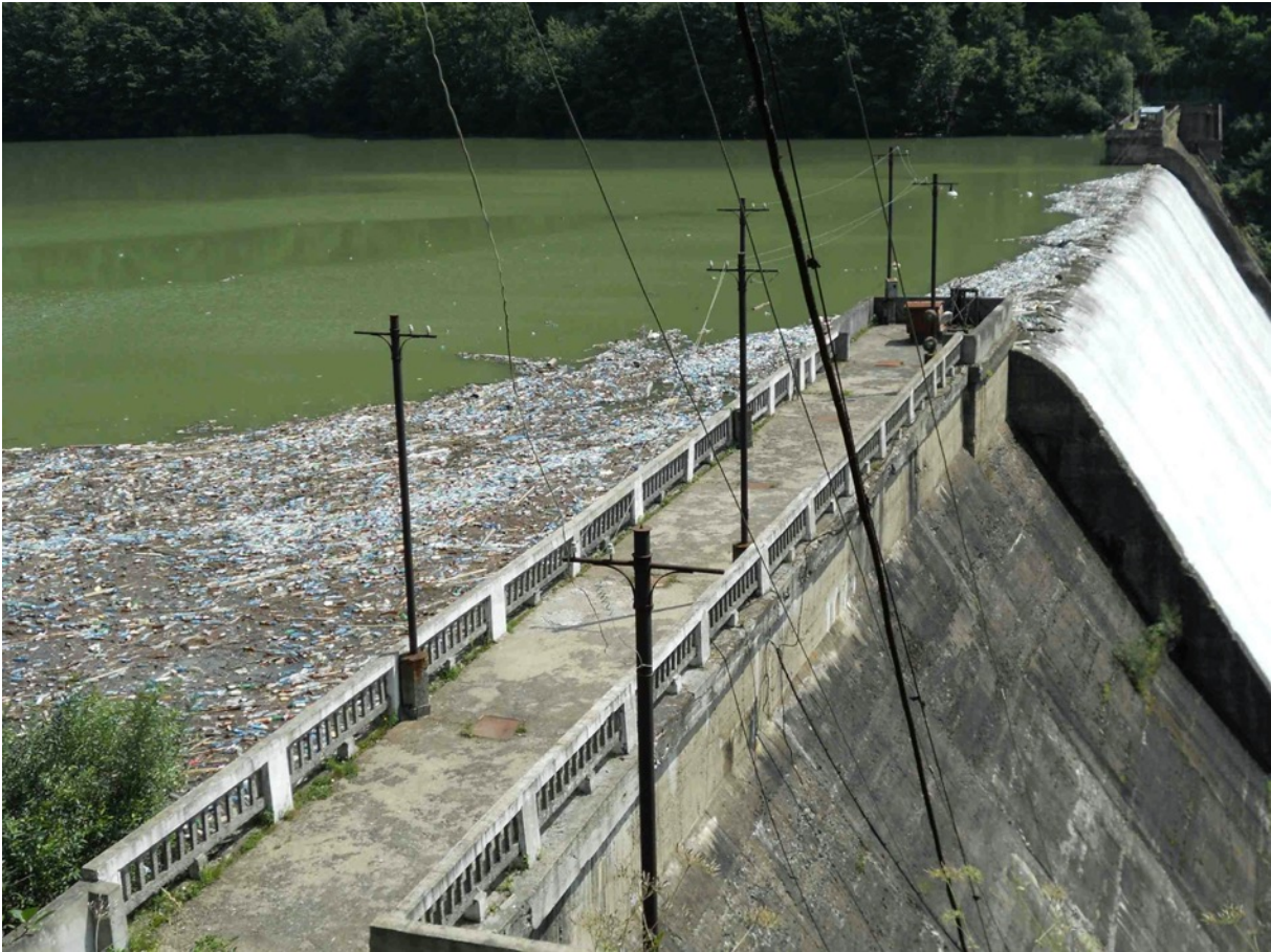
Das Umweltbewusstsein ist wenig ausgeprägt, die Umweltverschmutzung entsprechend gross.