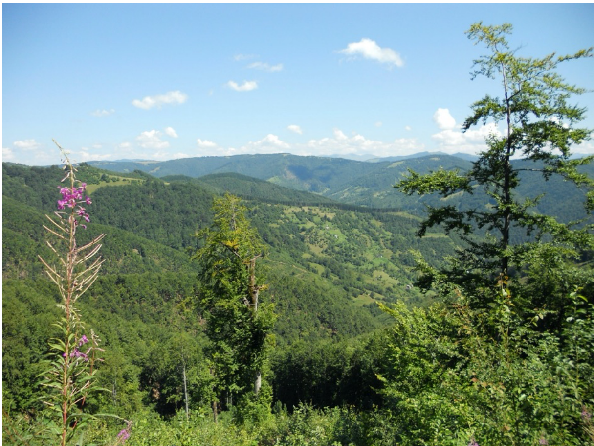
Die Karpaten – bewaldete Täler, Wiesen und Alpweiden.