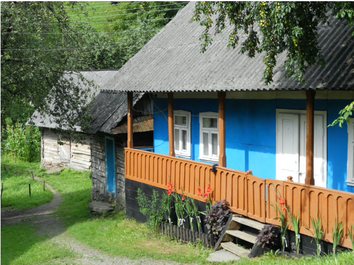
Flusslauf und Haus in Nyschny Bistryj