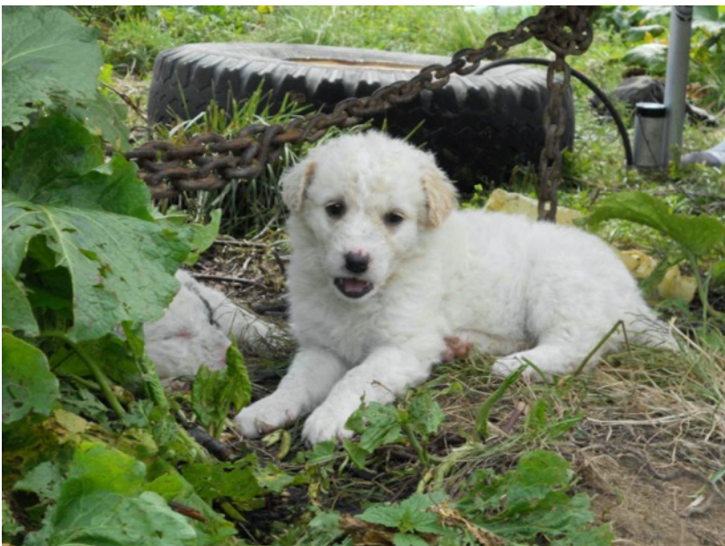
Hunde schützen die Herdentiere vor den Raubtieren.