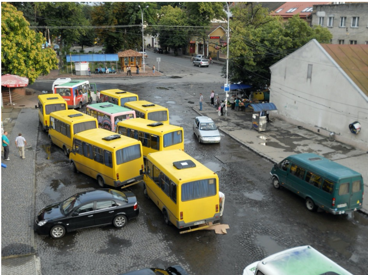
Ushchorod, die Hauptstadt Trankarpiens – Brücke über die Usch (oben) und ein Kleinbusparkplatz.