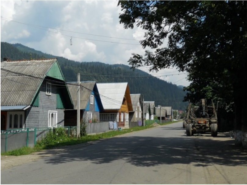
Typische Häuser in den ukrainischen Karpaten.