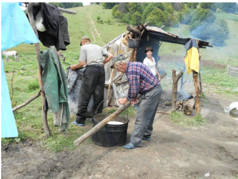
Auf einer einfachen Alp in den Karpaten. Falls abgebildete Personen dieses Dokument sehen, sind sie gebeten, sich zu melden!