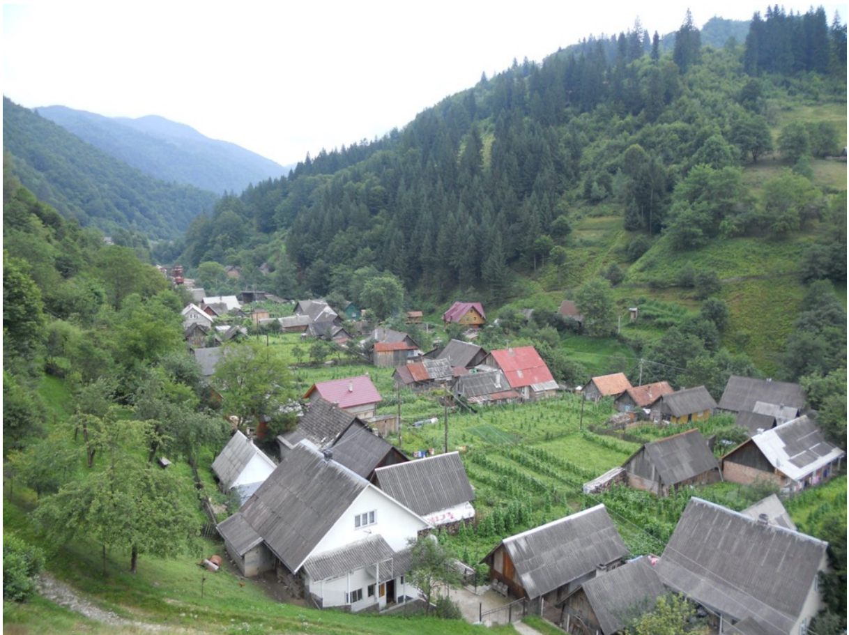
Ein Karpatendorf in der Nähe von Rachiw.