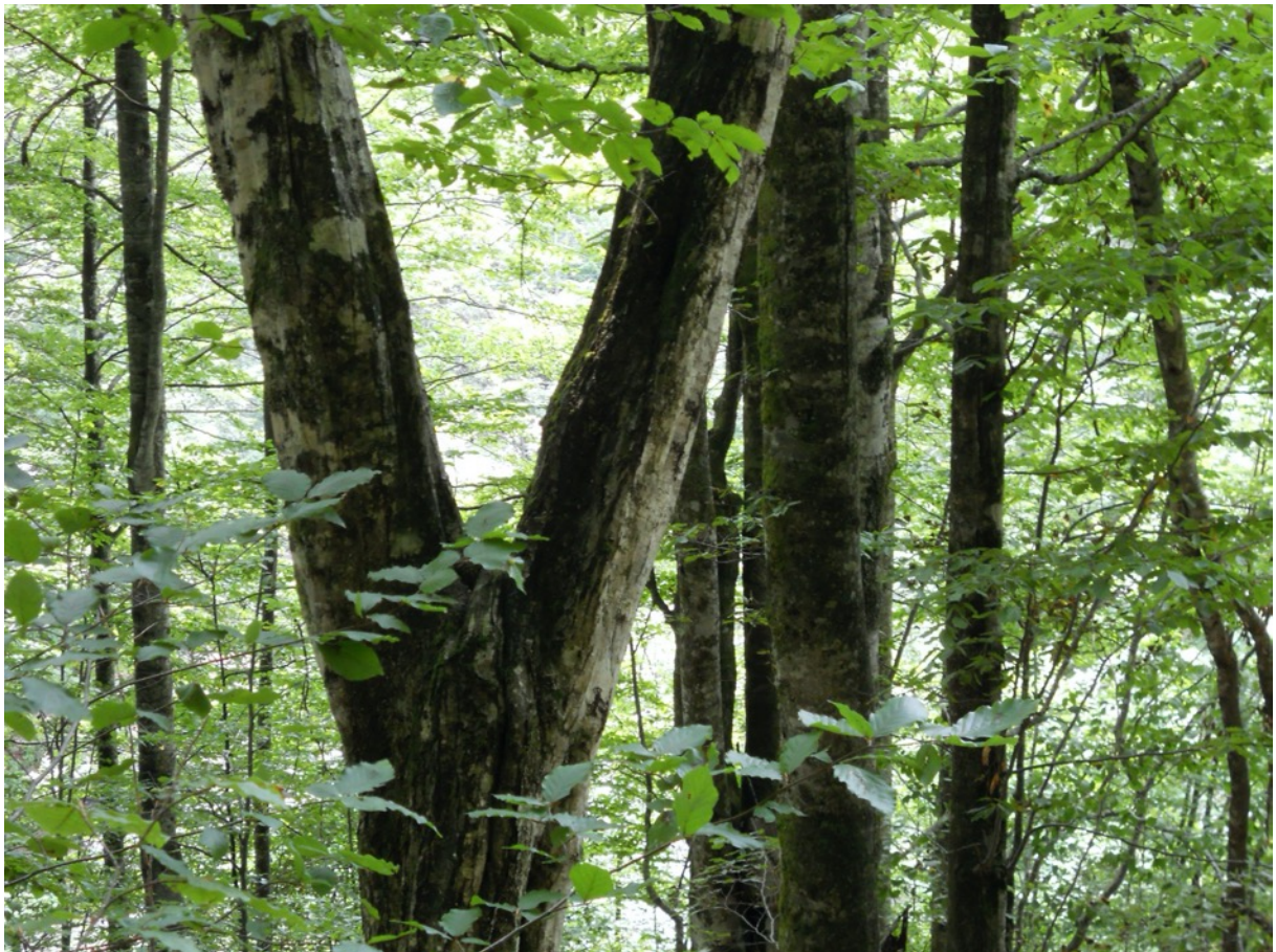
Im Buchenurwald von Schyrokyj Luh.