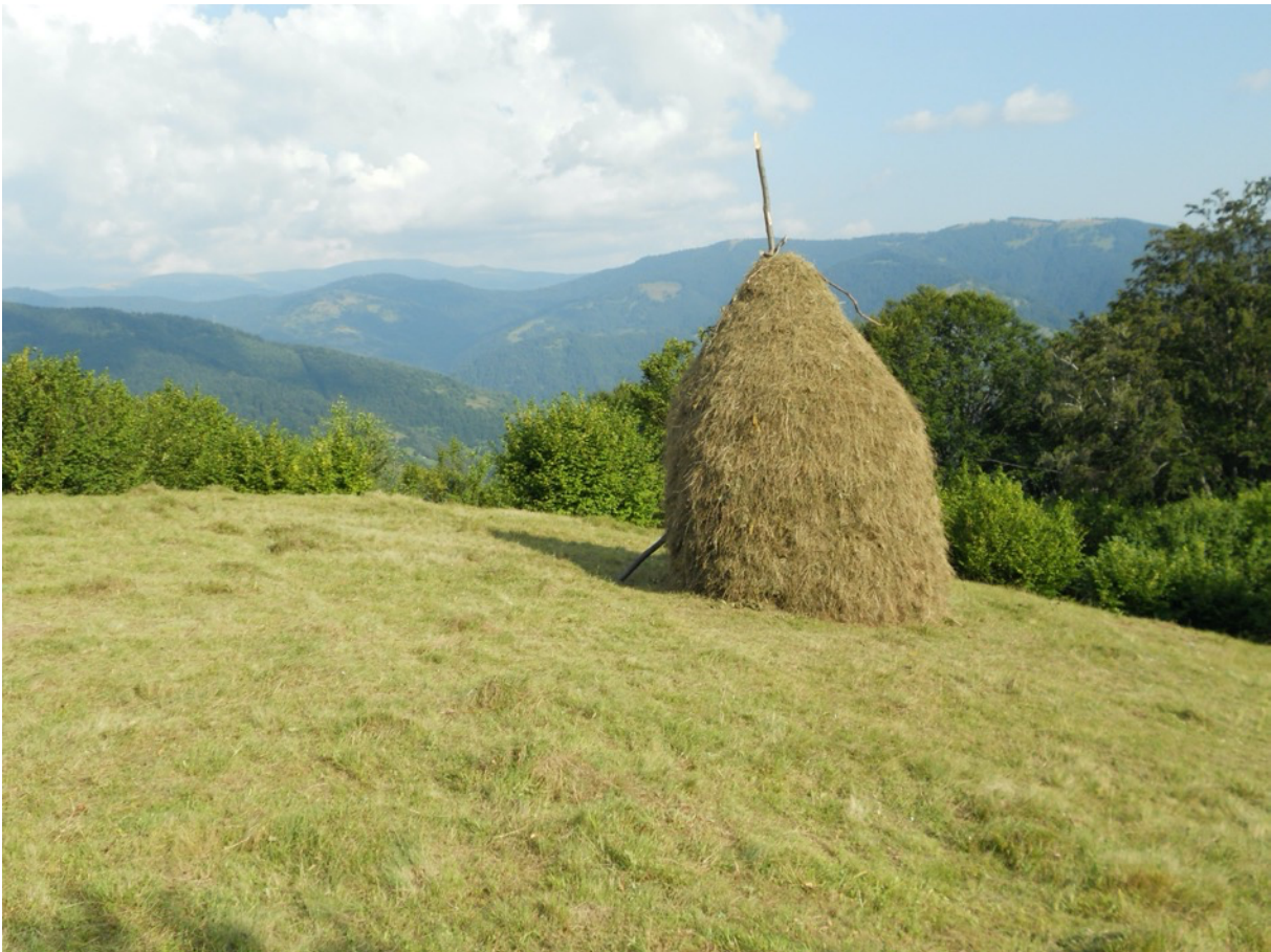
Wie Heu gelagert wird.