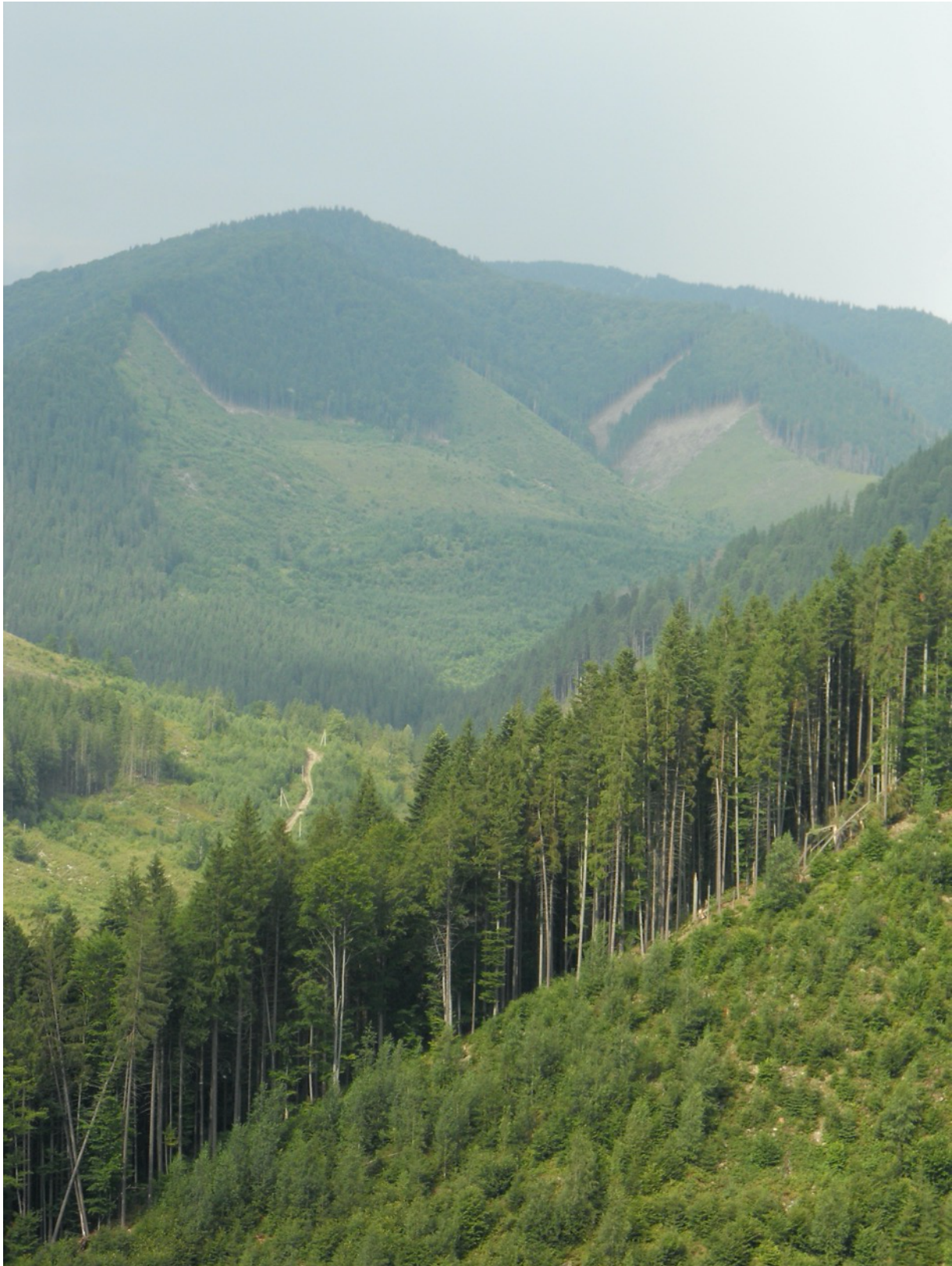
Grober Waldbau führt zu tiefen Narben in der Landschaft.