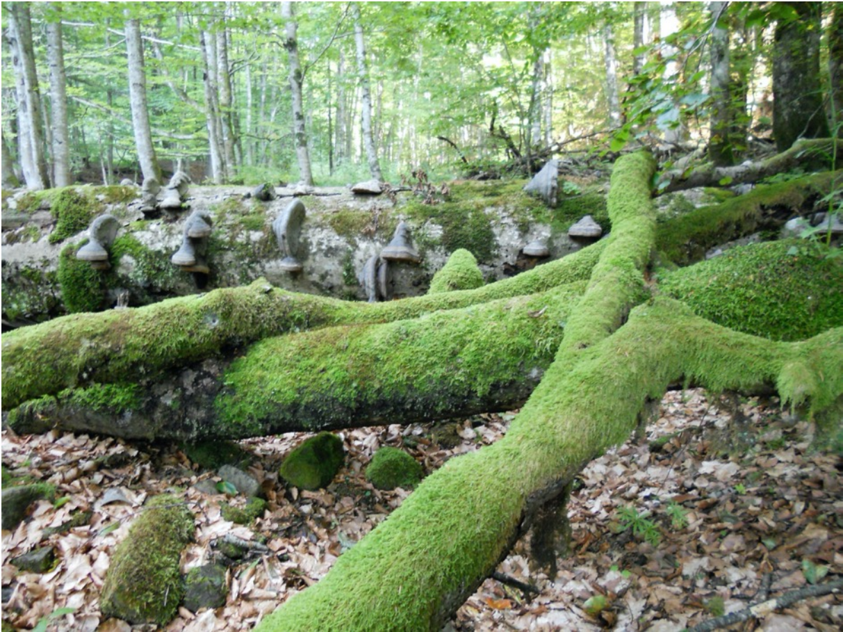
Viel Totholz ist ein Merkmal von Urwäldern.