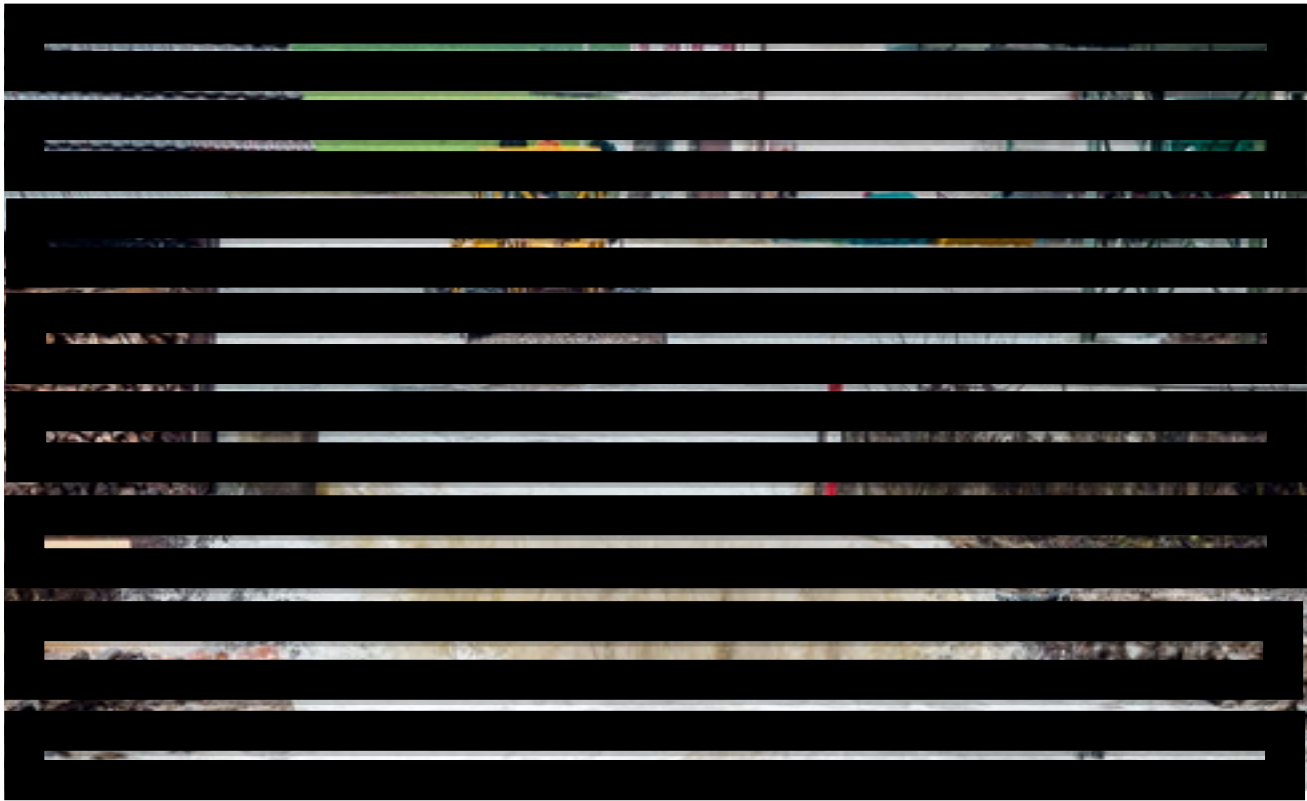
Am 11. Januar 2016 in Wolhusen LU : Nach einem Felssturz in die Kleine Emme folgten Überflutungen und Stromausfälle .

der TGV-Verbindung waren plötzlich viel mehr Passagiere diesem Risiko ausgesetzt. Um dieses wieder auf ein vertretbares Ausmass zu reduzieren, errichtete man für zwei Millionen Franken Steinschlagnetze. Dumm nur, dass der TGV heute nicht mehr durchs Val de Travers fährt. Ein anderes Beispiel: Die Bahnstrecke Zürich–Bern verläuft kurz nach Olten am Fuss des Born, eines Jura-Ausläufers. Durch die Frequenzsteigerung im Rahmen von Bahn 2000 wurde dieser Abschnitt zu einem Hotspot des SBB-Netzes bezüglich Naturgefahren. Der Zugverkehr war plötzlich so dicht, dass sich umgerechnet ständig 200 Personen im gefährdeten Gebiet aufhielten. Aus diesem Grund bauten die SBB Steinschlagschutzwände. Auf der Gotthard-Bergstrecke hingegen wird nach der Inbetriebnahme des Gotthard-Basistunnels infolge der geringeren Passagierfrequenzen das Risiko abnehmen.